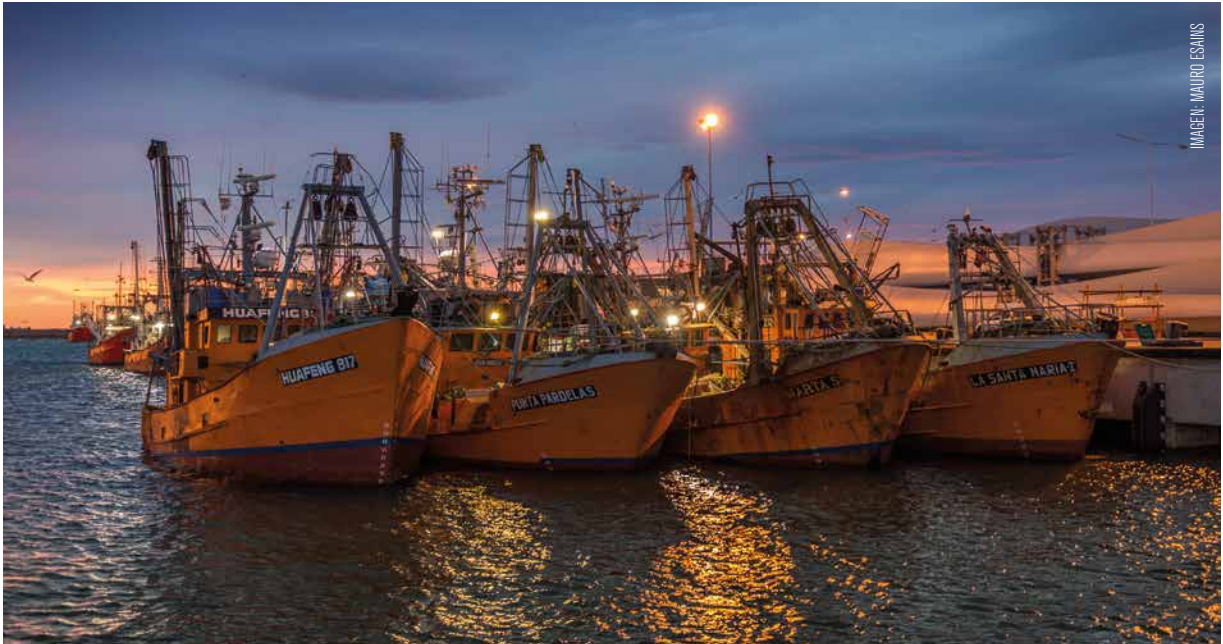
IMAGEN: MAURO ESAINIS

milla 201 estaríamos en números similares comparando un área con la otra.