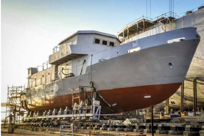
Figura 7 Lancha de instrucción para cadetes (LICA)