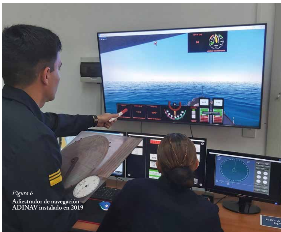
Figura 6 Adiestrador de navegación ADINAV instalado en 2019

La incorporación del adiestrador ADINAV amplió las posibilidades de simulación con buques, puertos y zonas de navegación argentinos.