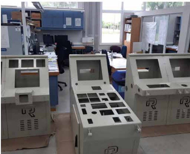
Figura 8 Consolas del puente de comando de las lanchas de instrucción para cadetes