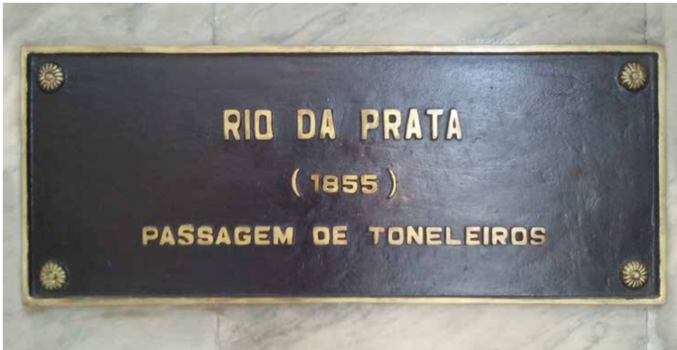
Placa que recuerda el combate por el Paso de Tonelero. Mausoleo del Duque de Caxias, Río de Janeiro. (Observación: la placa indica 1855, pero Tonelero se produjo en 1851).