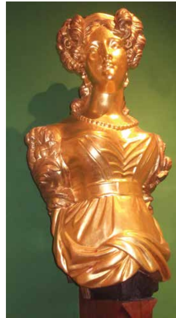
Mascarón de proa de la corbeta brasileña Dona Januária , que participó en el cruce del Paraná por el Ejército Grande. Museo Naval y Oceanográfico, Río de Janeiro.

rra moderna y profesional, con una concepción fuertemente fluvial y adecuada para defender los ríos y los territorios argentinos de la Cuenca del Plata. En definitiva, la conciencia de poseer una Armada acorde a la dimensión de los intereses marítimos y fluviales del país. ■