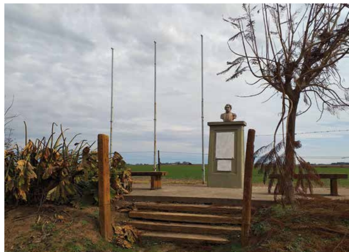
Sitio histórico del Campamento de Tonelero y monumento al General Lucio Norberto Mansilla, Ramallo (provincia de Buenos Aires).