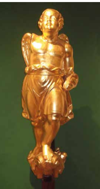
Mascarón de proa del vapor de guerra brasileño Affonso , insignia del contraalmirante Grenfell en Tonelero. Museo Naval y Oceanográfico, Río de Janeiro.

Para la Marina del Brasil, el combate de Tonelero constituye un acontecimiento importante, un verdadero Laurel Naval que integra sus hechos de armas más destacados.