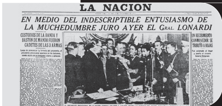
Cuadro 4 Apoyo a los golpes militares

«El 28/6/66 los militares derrocan a Arturo Illia e instauraban la dictadura del General Juan Carlos Onganía.