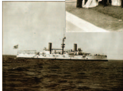
Acorazado San Martín .