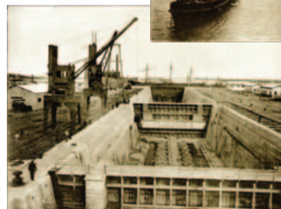
Dique de Carena – Puerto Militar – Bahía Blanca, Prov. de Buenos Aires.

La Biblioteca Nacional en 2010 reeditó una magnífica obra de fotografías realizada como parte de los festejos del Centenario de la Revolución de Mayo. Muestra una Argentina floreciente, con un avance arrollador y ubicada con justicia entre las primeras naciones del mundo.