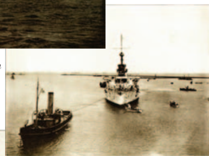
Acorazado San Martín entrando al Puerto Militar – Bahía Blanca, Prov. de Buenos Aires.