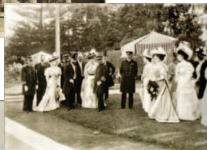
Paseo en los jardines de la Escuela Naval, Buenos Aires.