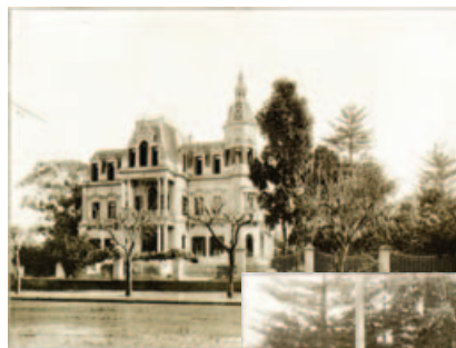
Escuela Naval, Buenos Aires.

Colección Fototeca Benito Panunzi de la Biblioteca Nacional, Edición de la Biblioteca Nacional, Buenos Aires, 2010.