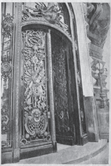
Edificio del Centro Naval en la esquina de Florida y Córdoba, obra proyectada por el arquitecto Gastón Luis Mallat