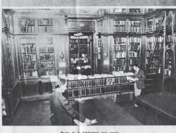
Parte de la biblioteca que posee más de 20.000 volúmenes