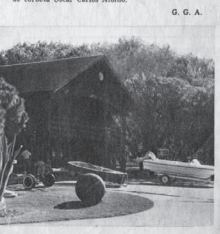
Un sector de las instalaciones sobre el río de la Plata, a la izquierda, y construcción destinada a guardar embarcaciones que el Centro Naval posee en la localidad bonaerense de Vicente López