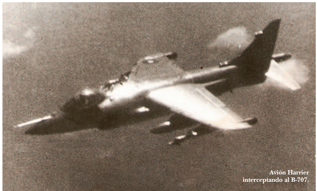
Avión Harrier interceptando al B-707.

No entraré en detalle sobre la operación, pues está descrita en detalle en el Capítulo 16 del libro del Almirante Mayorga. Sí, quiero acotar que todos proveyeron información importante, en particular la búsqueda aérea, que en el primer vuelo descubrió a los portaviones a sólo 60 millas de la posición que estimábamos: