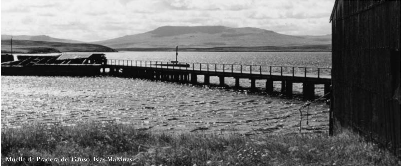
Muelle de Pradera del Ganso, Islas Malvinas.

abandono voluntario de los derechos por la parte de quien pierde el título, y la necesidad de preservar el orden y la estabilidad internacionales (Ob. Cit. En Ferrer Vieyra, 1984: 158).