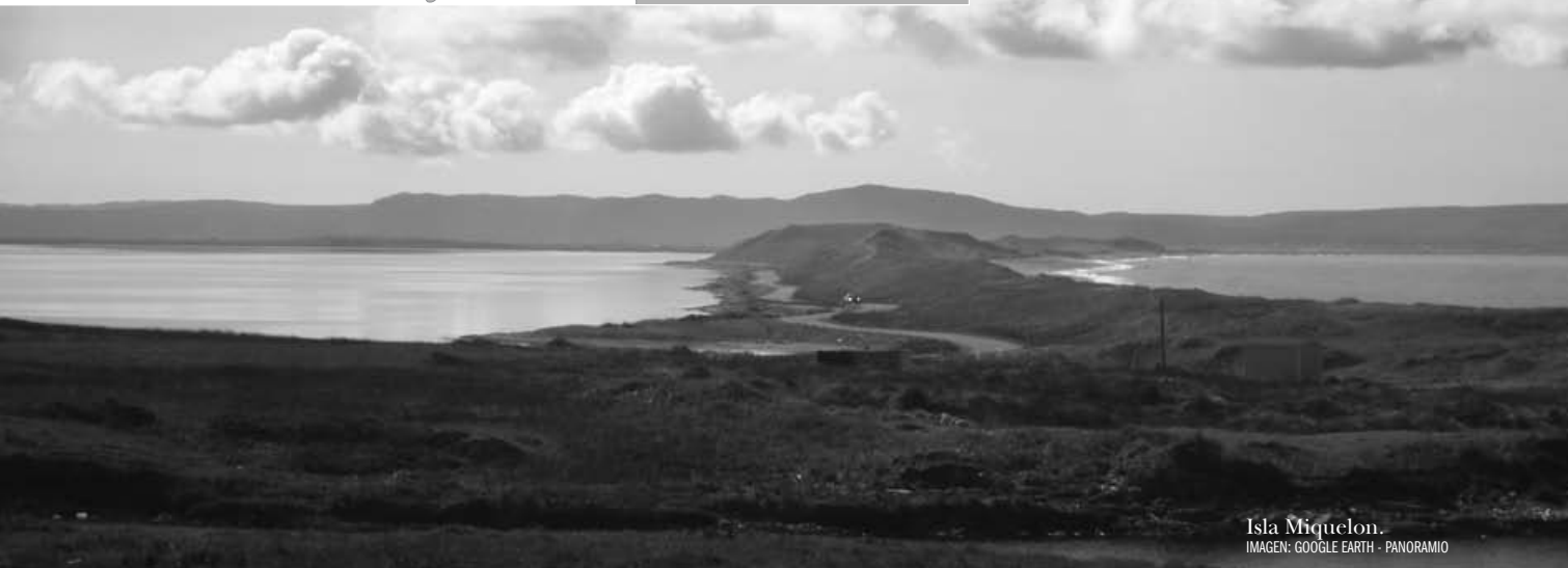
Isla Miquelon.

En “El territorio del Estado y la Soberanía Territorial”, el Dr. Julio Barberis nos enseña que “La cesión territorial es un acto mediante el cual un Estado transfiere a otro parte de su territorio” (2003). Aclara después que este acto nace de una convención, es decir, de un acuerdo entre partes. Eso fue lo que sucedió con el Tratado de París de 1763, en el que Gran Bretaña cedió a Francia las referidas islas, entre otros territorios.