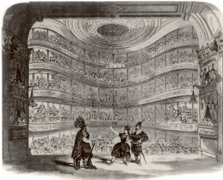
Vista interior del Teatro Bowery, publicada en la edición del 13 de septiembre de 1856 en Frank Leslie's Illustrated Newspaper .

( HTTP://UPLOAD.WIKIMEDIA.ORG/WIKIPEDIA/COMMONS/6/62/BOWERY-THEATRE-LESLIE-1856.JPEG Y HTTP://MEMORY.LOC.GOV/MASTER/PNP/CPH/3A00000/3A06000/3A06100/3A06192U.TIF )