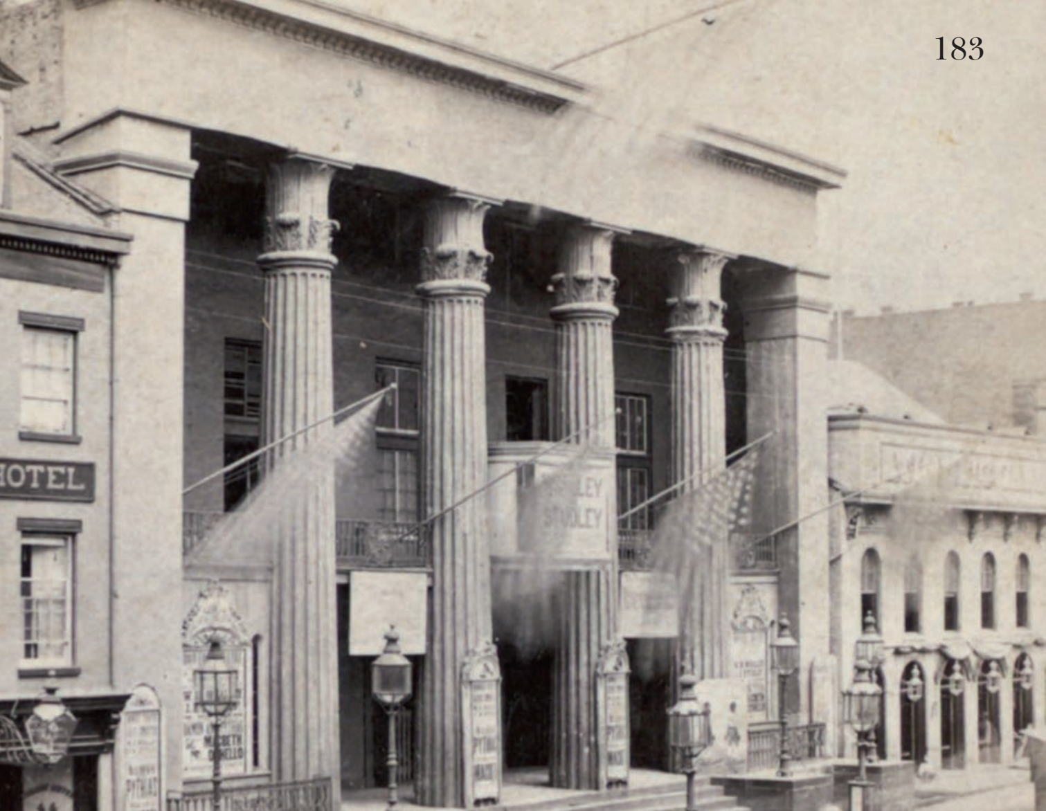
Old Bowery Theatre, New York.