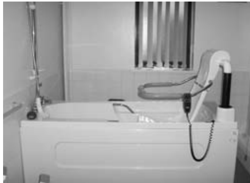
Bañera especial para pacientes discapacitados.

Este cuadro fue realizado por un veterano de Guerra de Malvinas internado en Audley Court. El mismo había recibido un disparo que le destruyó el maxilar. La imagen describe el intenso dolor sufrido que no era capaz de expresar con palabras. Esto constituye parte de la denominada Terapia Ocupacional. Los veteranos de guerra pueden llegar a expresar también sus sentimientos a través de la poesía, existiendo para ellos terapeutas especializados. (Arthur Lerner Ph.D (Ed)-Poetry in the Therapeutic Experience, 2nd edition).