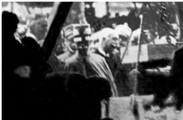
S.M. el Rey de Italia Vittorio Emanuele III procede a colocar la piedra fundamental, el 27 de abril de 1925 ( La Patria degli Italiani , 27 de mayo de 1925).