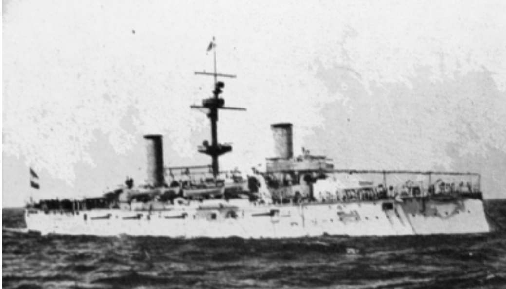
Crucero acorazado Belgrano (Pablo Arguindéguy. Apuntes sobre los buques de la Armada Argentina , tomo IV).

El día 1° el Papa recibió a los guardiamarinas de la fragata Presidente Sarmiento que estaba en Roma, de paso hacia Génova (9)(10)(11). Esta entrevista fue impresionante y se efectuó de la siguiente forma: los cadetes formados a ambos lados del salón se cuadraron a la aparición del Pontífice, que entró precedido por un piquete de guardias suizos y acompañado de su corte eclesiástica. Pío XI, que vestía completamente de blanco, fue recorriendo la fila de los cadetes y dando a besar su mano a cada uno de los visitantes (12).