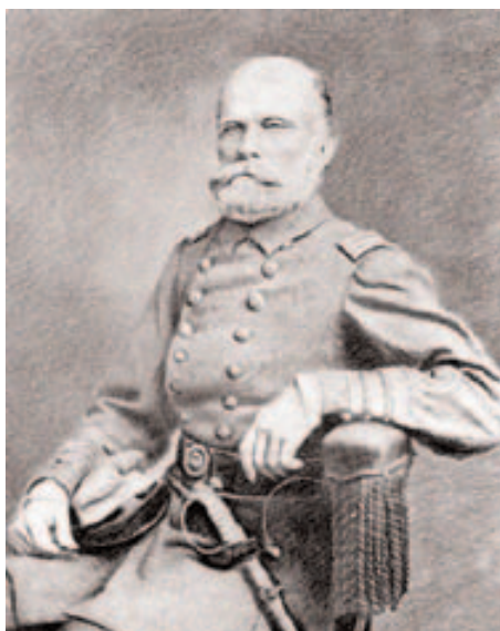
Comodoro Thomas Jefferson Page (1808-1902). Pionero en la exploración del río Paraguay y Bermejo. Inspector para el gobierno Argentino de la construcción de los monitores El Plata y Los Andes y las cañoneras Paraná y Uruguay durante el gobierno de Domingo Faustino Sarmiento. Ex Comandante del monitor CSS Stonewall de la marina Confederada. (Referencia: www.gloucesterva.info/museum/HallOfFame/cijpage.htm ).

Page se distinguió en la ejecución de tareas